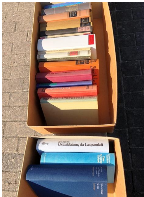
Trên thùng các tông dán miếng giấy: Zum Mitnehmen: xin cứ lấy (sách)